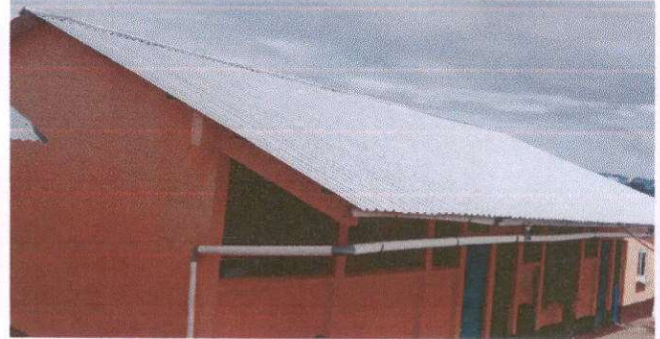
FOTO 2: Sustitución de estructura de soporte de madera por metal (Modulo 1)