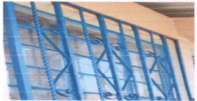
Foto 6: Fabricación e instalación de balcones de hierro en ventana (Modulo 1)

Observación: Si es necesario se pueden agregar hojas adicionales y actualizar el número de hojas.