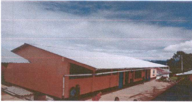
FOTO 1: Sustitución de lamina por lamina troquelada aluzinc (Modulo 1)